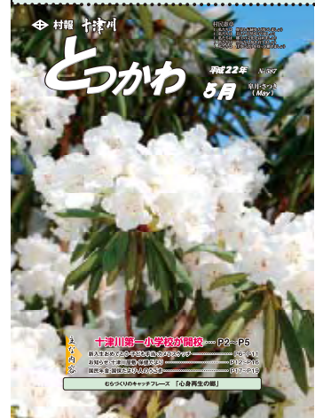
21世紀の森・森林植物園の赤星シャクナゲ